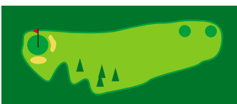
Trous 4 & 13