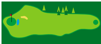
Trous 3 & 12