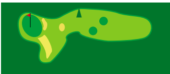
Trous 2 & 11