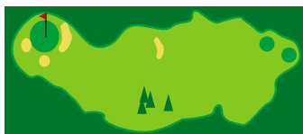
Trous 1 & 10

Village de Charade (Accès par le circuit) 63130 ROYAT tél. 04 73 35 73 09 www.golf.charade.neuf.fr contact : golfderoyatcharade@hotmail.com