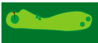
Trous 7 & 16