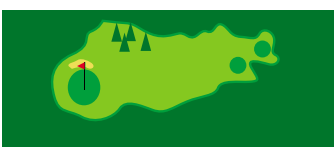
Trous 8 & 17