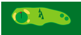
Trous 5 & 14